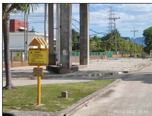
ป้ายแสดงหมายเลขโทรศัพท์แจ้งเหตุที่ชัดเจน