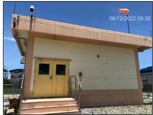
ติดตั้งกล้องโทรทัศน์วงจรปิด เพื่อรักษาระบบความปลอดภัย 24 ชั่วโมง