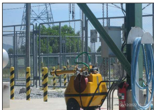
ติดตั้งเครื่องดับเพลิงแบบเคมีผงที่บริเวณสถานีวัดและควบคุมแรงดันก๊าซ (MRS)