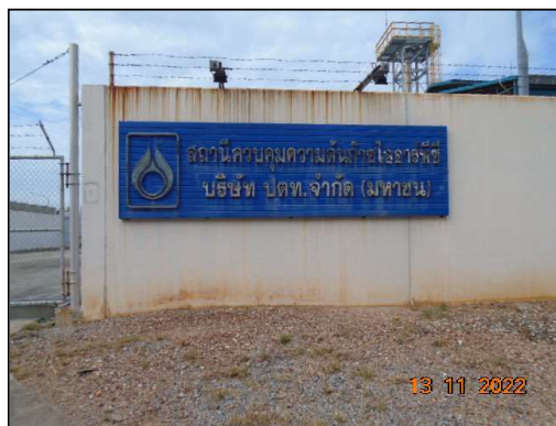
ป้ายสถานีควบคุม