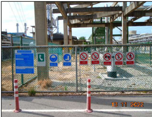
ป้ายเตือนความปลอดภัยบริเวณสถานี