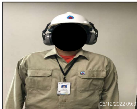
จัดเตรียมอุปกรณ์ป้องกันอันตราย ส่วนบุคคลให้กับพนักงาน