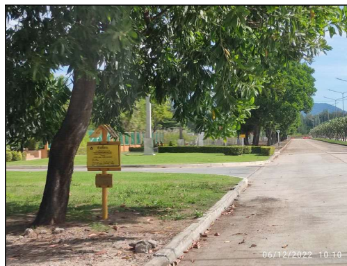
ป้ายแสดงตำแหน่งแนวท่อส่งก๊าซธรรมชาติ